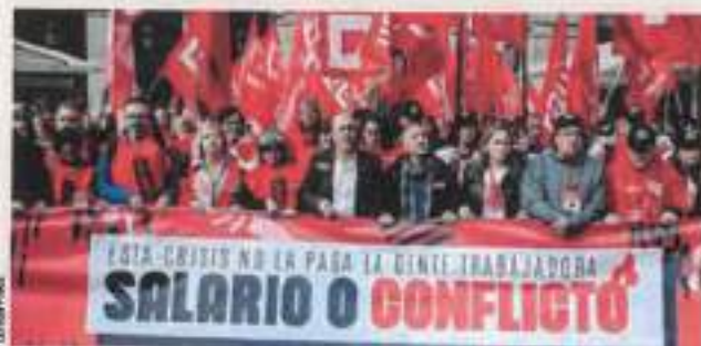
Los sindicatos reclamaron ayer en Madrid a la patronal subiese salarios con la inflación.