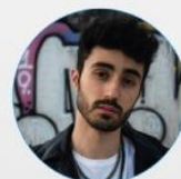
Drolu Mago e influencer