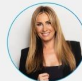
Izaskun Unzain Directora General de EFIC