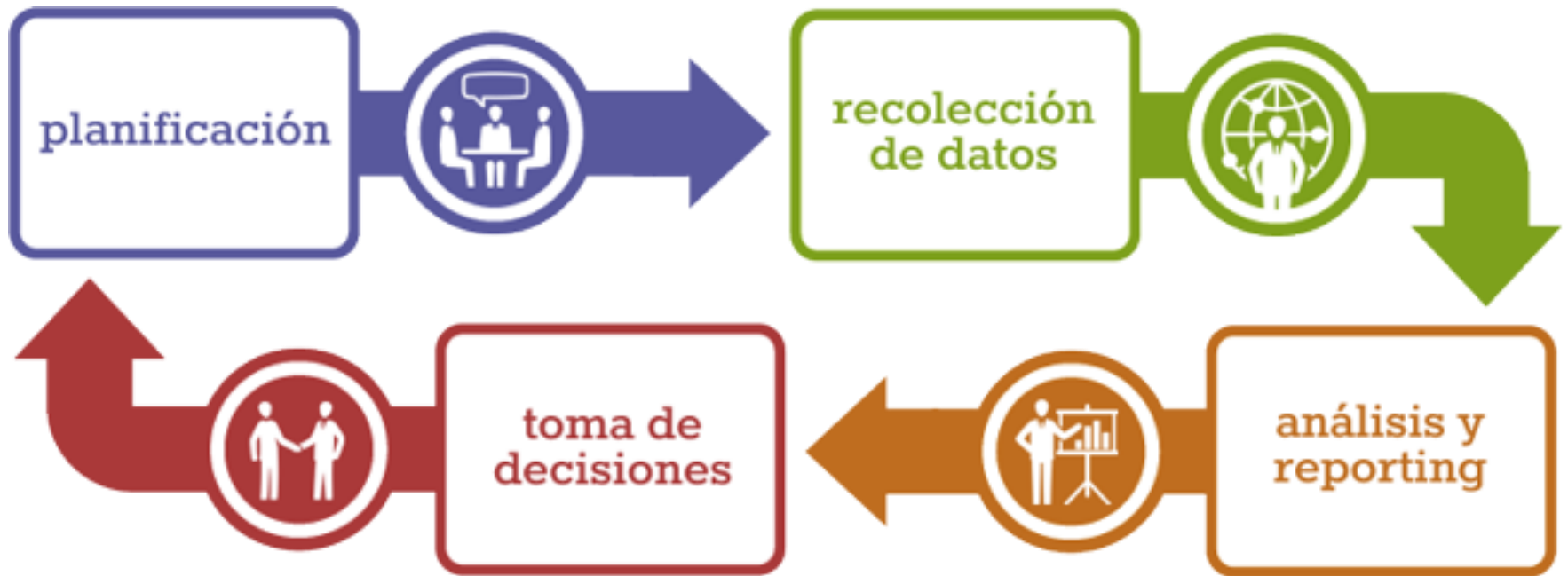
Modelo cíclico en el plan de Marketing Digital